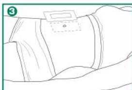
3 Приложить пластырь абсорбирующей подушкой к ране.