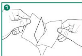
1 Раскрыть упаковку и вынуть пластырь.