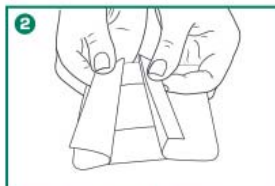
2 Снять защитную бумагу.