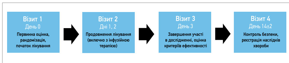
Рис. 1. Схема дизайну дослідження RheoSTAT-CP0698

лікувалися в 44 клінічних центрах 7 країн. У субдослідженні RheoSTAT-CP0698 брали участь 150 пацієнтів із 12 клінічних центрів 6 країн – України, Молдови, Грузії, Узбекистану, Казахстану та В'єтнаму.